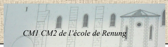
CM1 CM2 de l'école de Renung

Les maçons termineront à la fin du mois de septembre 2011. La classe de CM1 et CM2 a aimé la sortie à l'église ST Pierre. C'est notre patrimoine français. Celle-ci est très jolie car c'est un monument historique et vous devez aller la visiter !