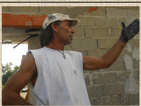
Un ouvrier sérieux !

Pour arriver à Renung, un petit village calme, on monte une côte très étroite. Les champs et les arbres dominant la moitié du village. On rencontre des lapins. Quand on est en haut de la pente, on voit à l'horizon et c'est très beau. En haut de la côte, on aperçoit le bourg de Renung avec une petite route à côté de la mairie. La place est longée d'arbres et du sable jaune en recouvre le cœur. Si on continue tout droit et que l'on tourne à droite, on voit l'école. De la classe, on peut contempler l'église St-Pierre qui se fait rénover car elle est très ancienne et abîmée par l'humidité qui creuse dans les murs. Elle a été construite au XVème, XVIème et XIXème siècle, certaines parties ont 500 ans. L'église est classée monument historique et fait partie du patrimoine. Son clocher est très très haut et les murs