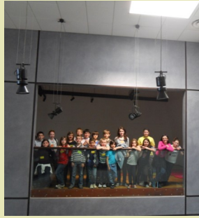
La photo de classe à Samadet