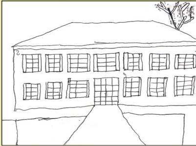
Illustration de Rémi Cassaigne, Cm2

Le Mardi 5 avril 2011, les CM1-CM2 de l'école de Renung sont allés à Samadet pour découvrir de l'architecture moderne et ancienne .