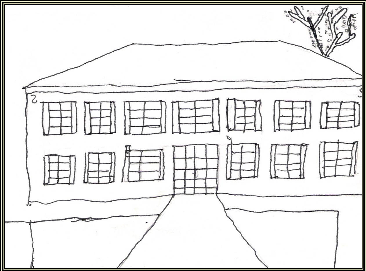
Illustration de Rémi Cassaigne , Cm2