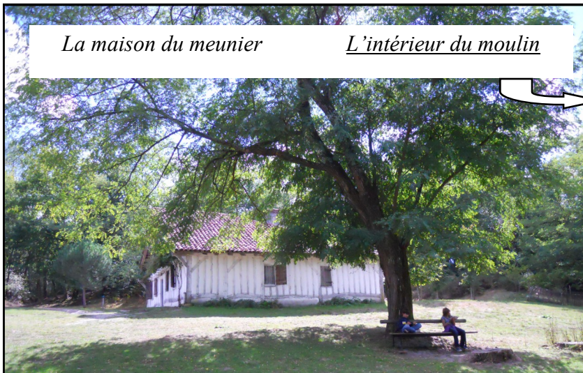
L'intérieur du moulin