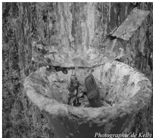
Photographie de Kelly